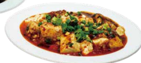
3.豆腐のスパイシー炒め