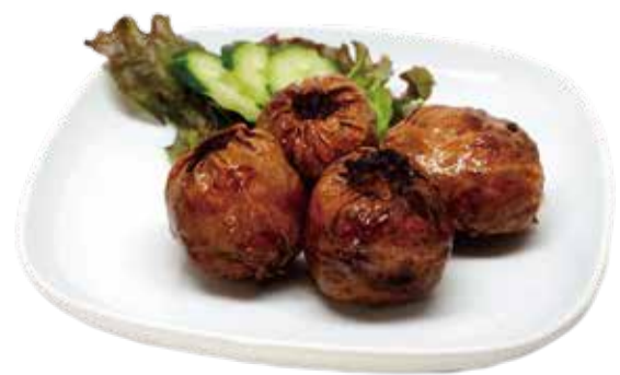
8.蟹肉の湯葉巻き油揚げ