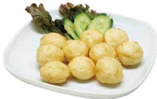
6.烏賊ボールの油揚げ (10個)