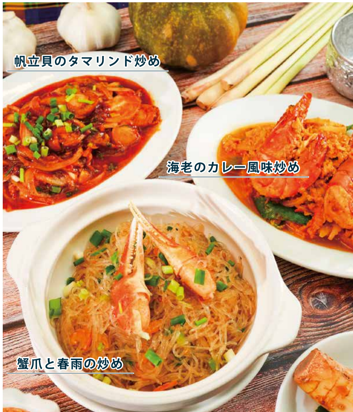
帆立貝のタマリンド炒め