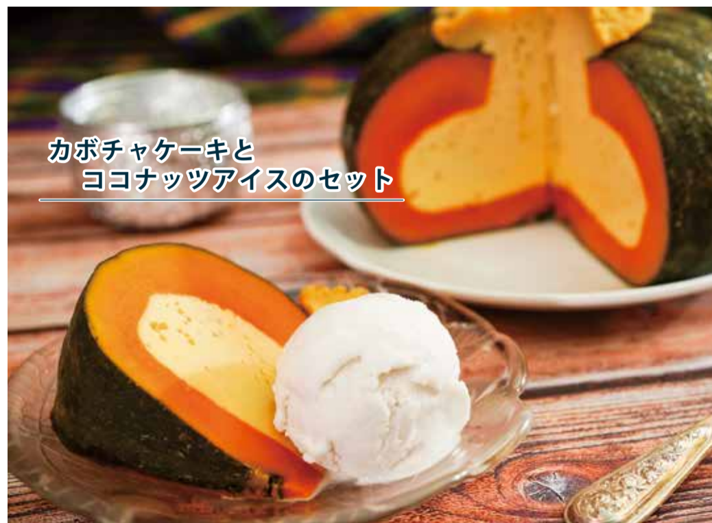
カボチャケーキと ココナッツアイスのセット