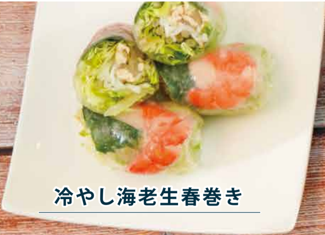
冷やし海老生春巻き