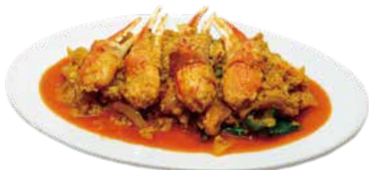
3. 蟹爪のカレー風味炒め