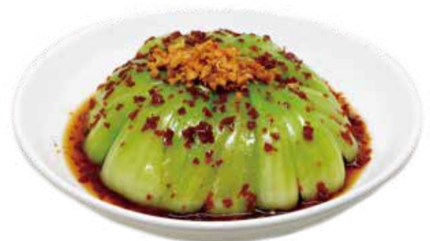
3.蒸し鶏の青梗菜包み