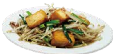
4.厚揚げのニラ炒め