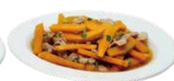
4. 豚肉かぼちゃ炒め