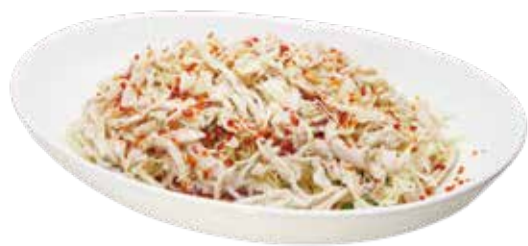
1.スパイシーチキンサラダ