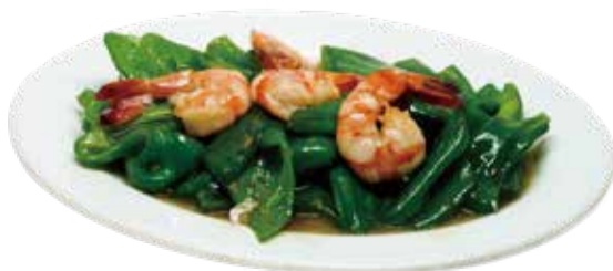
8. 海老ピーマン炒め