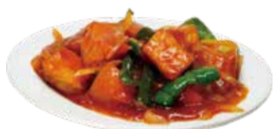
5.厚揚げの甘酢あんかけ