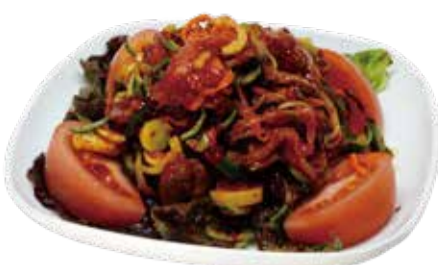
3.牛たたきの辛いサラダ