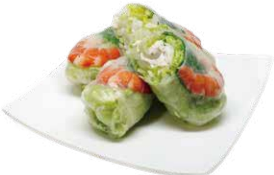
1.冷やし海老生春巻き (2本)