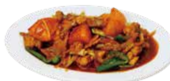
7. 鶏肉のスパイシー炒め