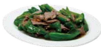
5. 牛肉ピーマン炒め