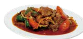
8. 牛肉のスパイシー炒め