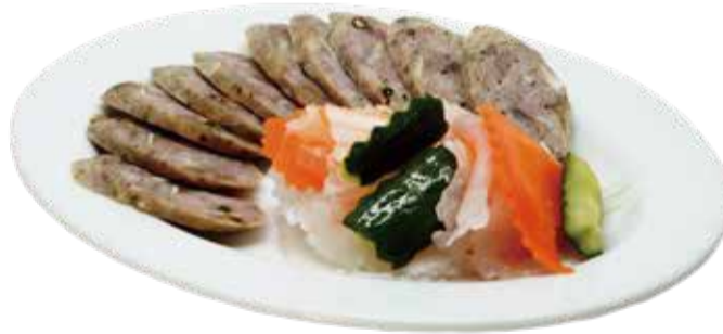
2.自家製ソーセージ