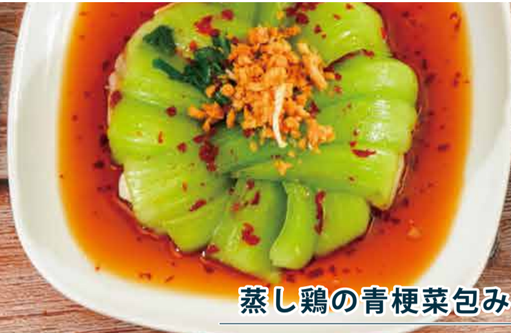
蒸し鶏の青梗菜包み