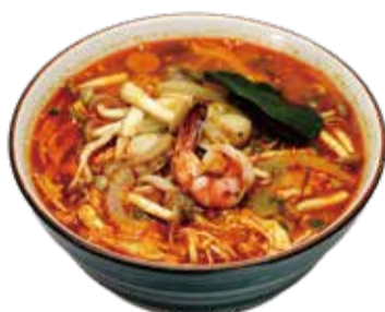
3.トムヤムクィティウ