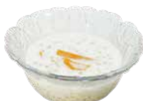
6.ココナッツタピオカデザート