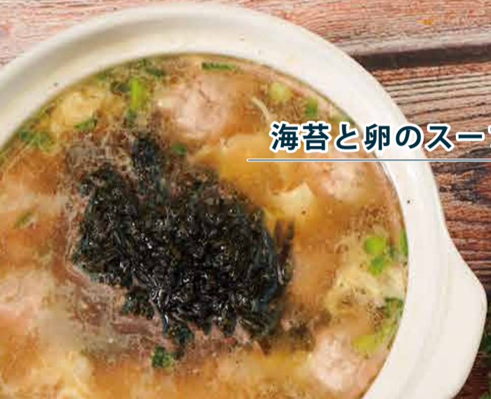
海苔と卵のスープ