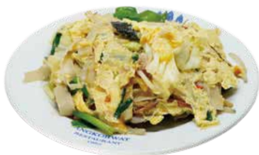
5.五目焼きクィティウ