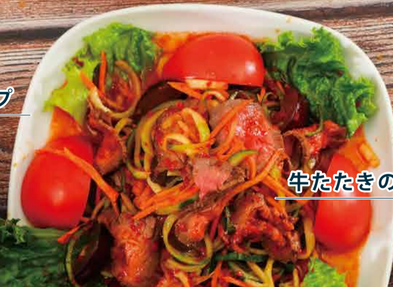
牛たたきの辛いサラダ