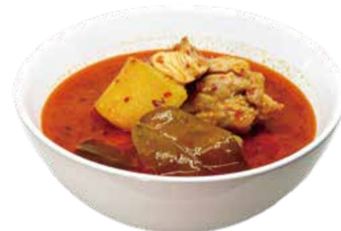
3.さつま芋のチキンカレー